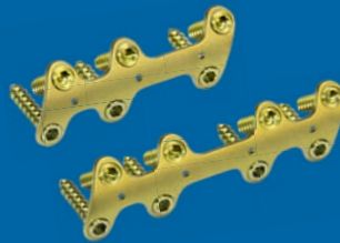
RPS™ Rearfoot Plating System

Mehrlochplatte für komplexe Rekonstruktionen und Arthrodesen.