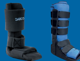
NightSplint™ und AirTraveler™ Walker

Bewährte Produkte für die Stabilisierung und Ruhigstellung.